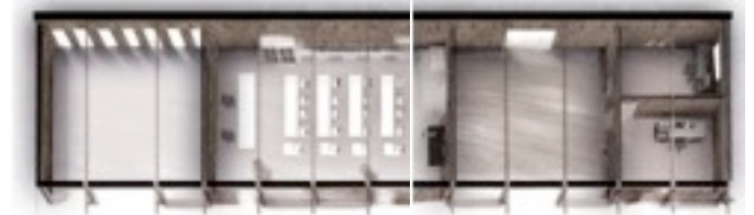
indeling van het gebouw