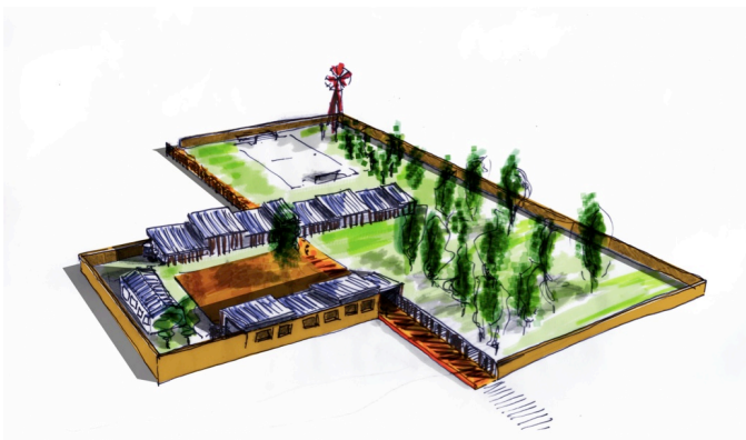
voorlopig plan, 2012