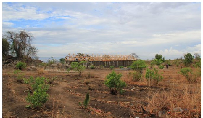
het dak zit er bijna op