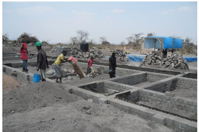
tijdens de bouw