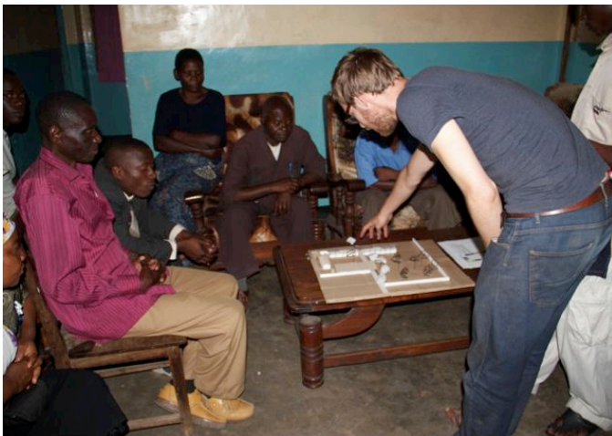
overleg in Mkwajuni, 2012